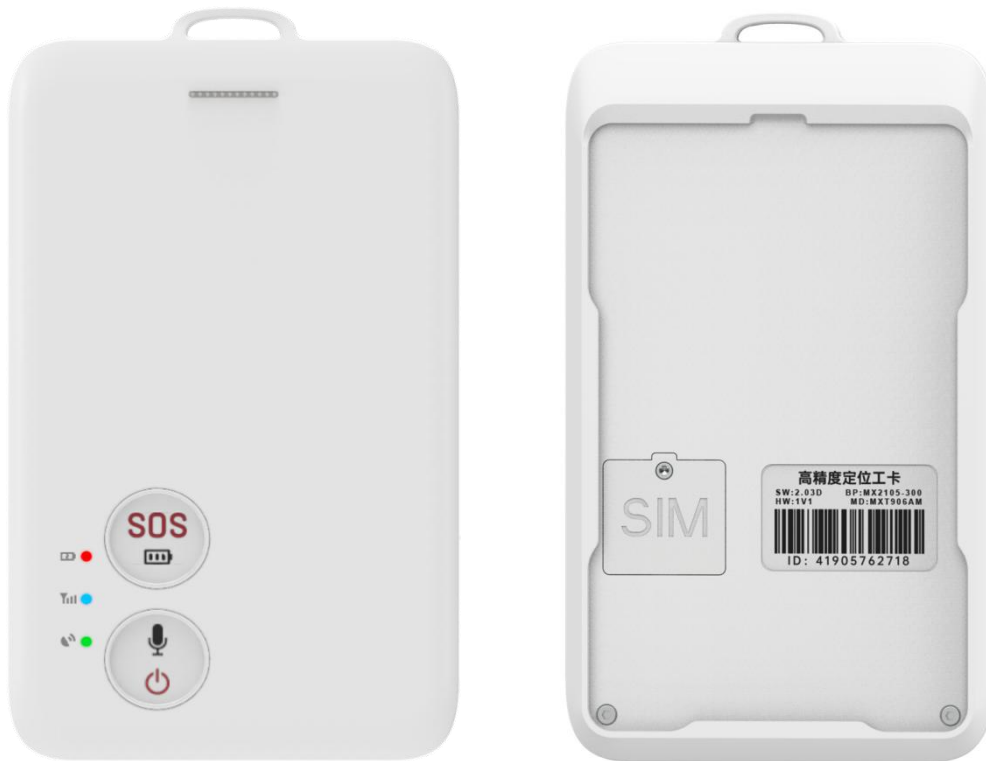
4G 人员定位工牌正反面效果图