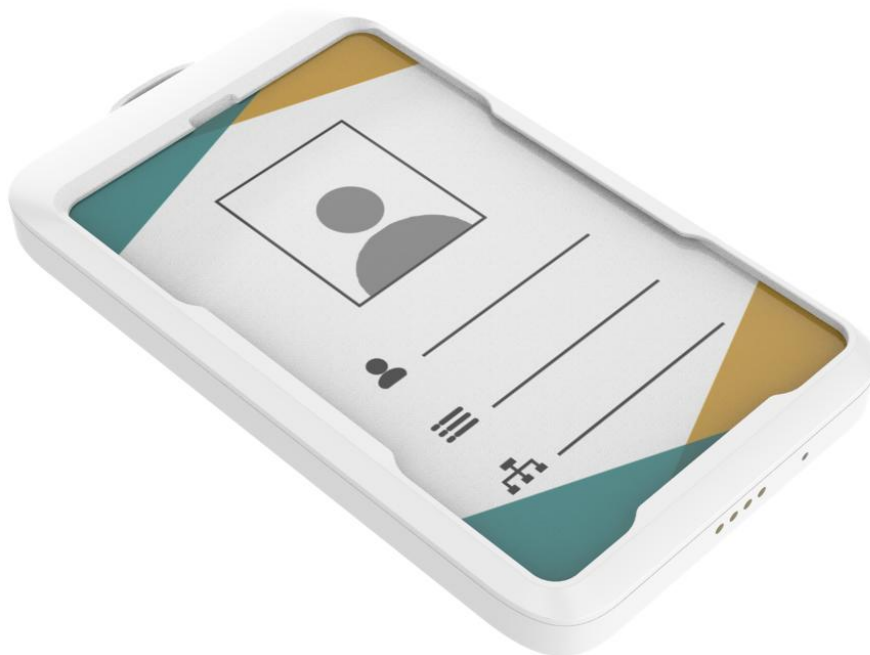
4G 人员定位工牌立体效果图